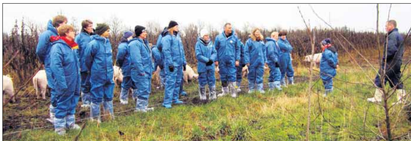
Efter rundvisningen på Hestbjerg Økologi er lærerne bedre klædt på til at undervise i økologisk svineproduktion.