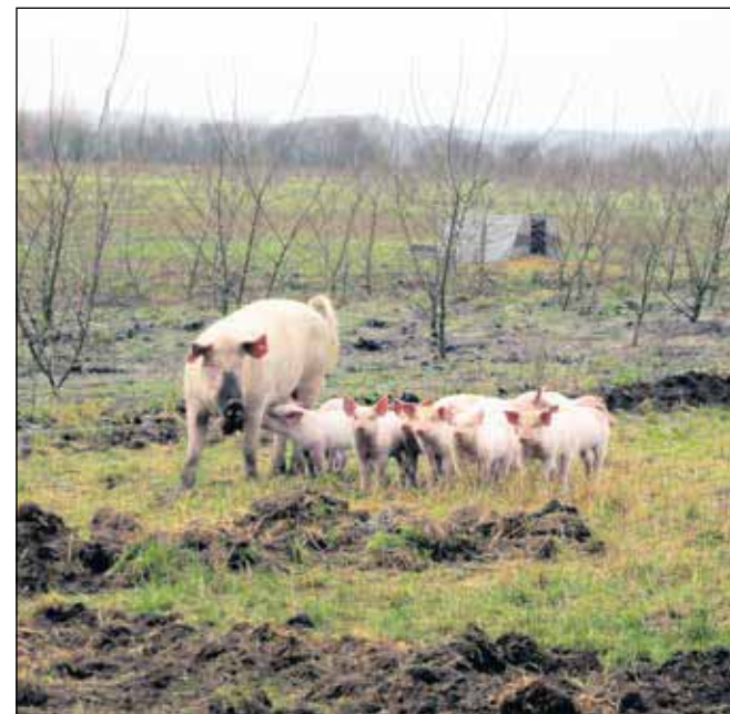
På Hestbjerg Økologi går grisene hos soen til de er 10 uger gamle. Nogle søer har adgang til popler, her er det endnu bare pattegri-sene, der kan gå i poplerne. P-ecosystem undersøger effekten på miljøet, når en del af grisenes gødning havner mellem poplerne.